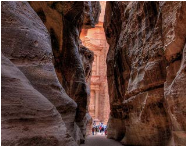
LA ENTRADA A LA CIUDAD DE PETRA (de 12 a 20 pies de ancho con paredes de 200 a 250 pies)